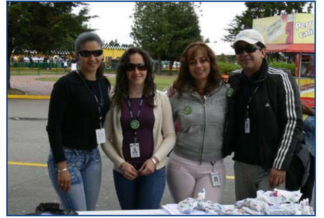
El Equipo de Fontebo organizó el evento