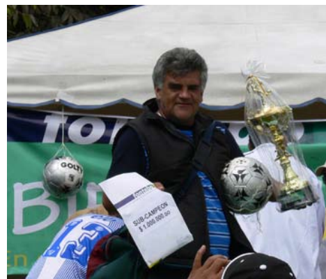
Con todos los trofeos