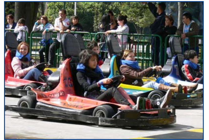
La competencia, parte del entretenimiento