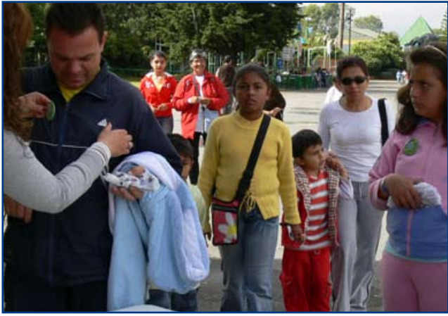
Todos llegaron cumplidos al Salitre