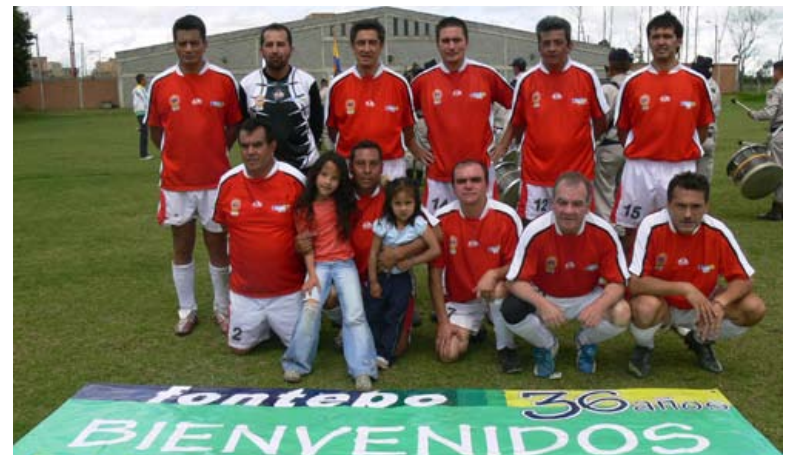
No dejaron pasar la oportunidad de la foto para el archivo