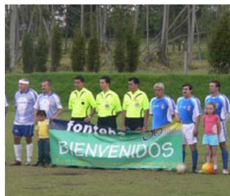
Cantando los himnos