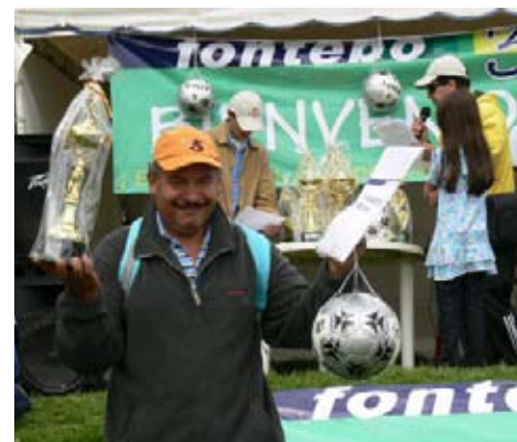
El éxito no se puede esconder