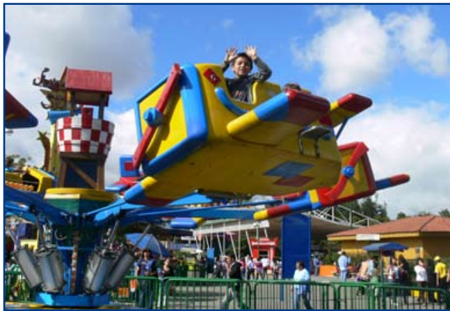
De todas maneras hay que hacerse notar