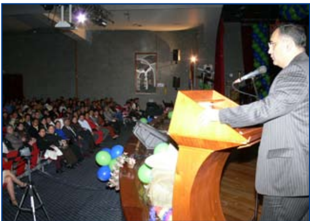
Palabras del Gerente