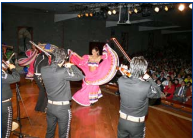
Llegaron los mariachis