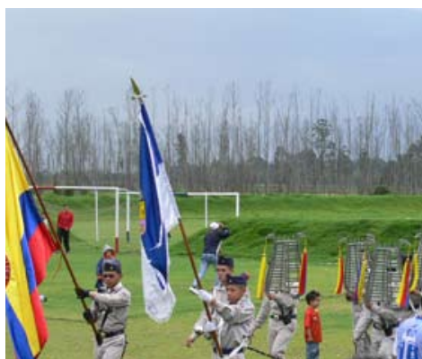
Desfile de apertura