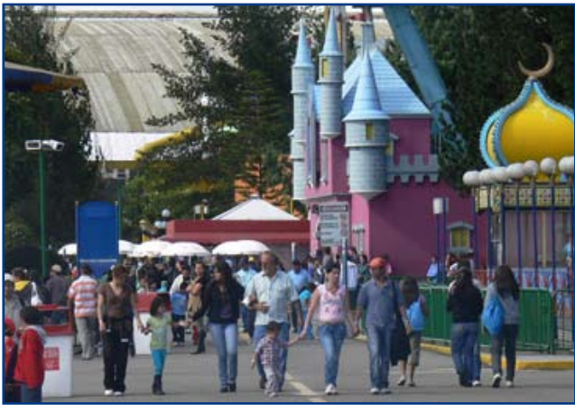
Las familias se unieron para la diversión