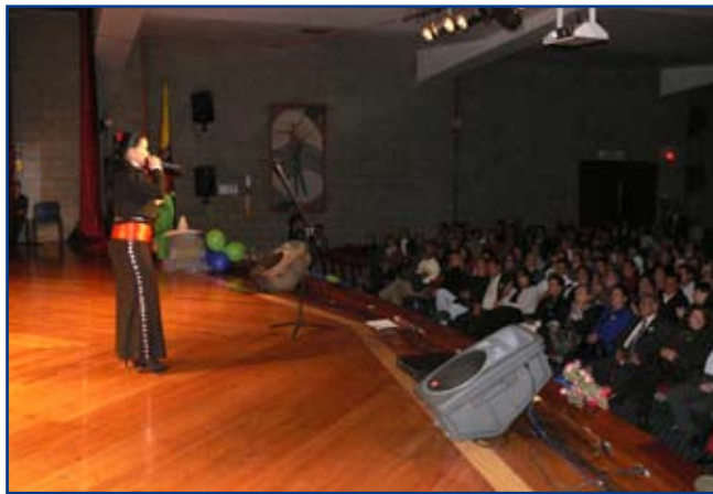
Y para terminar la cantante