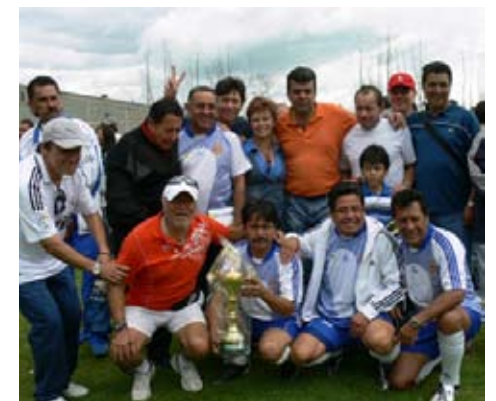
Se nota la felicidad