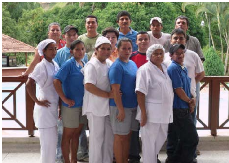
Naturaleza, ecoturismo, un lugar excepcional para el descanso

A sólo unos minutos del municipio de Melgar, se encuentra ubicado el Centro Recreacional Fontebo CRF, de 63.000 metros cuadrados, rodeados de naturaleza. Un destino ideal para compartir en familia,