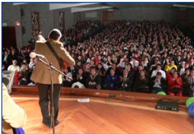
Comienzan los boleros