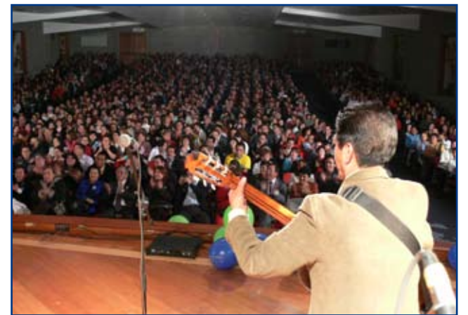
La musica y el recuerdo encantó