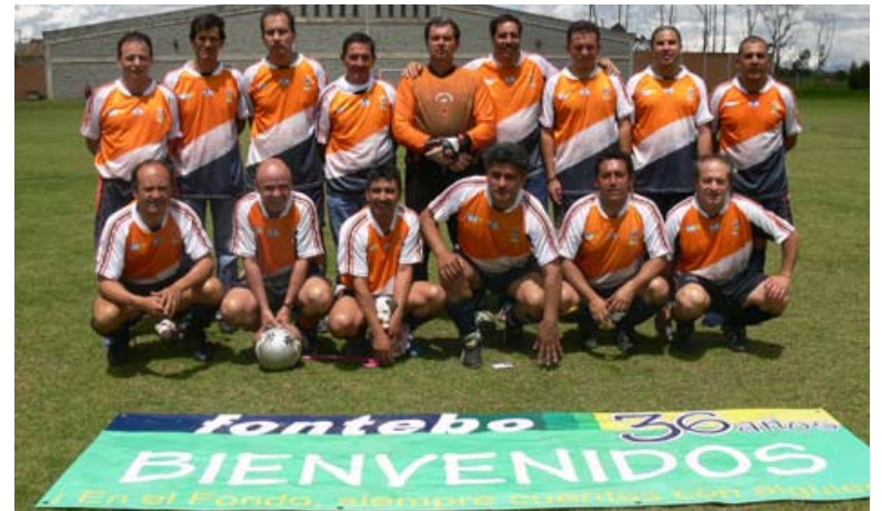
Los campeones siempre disciplinados