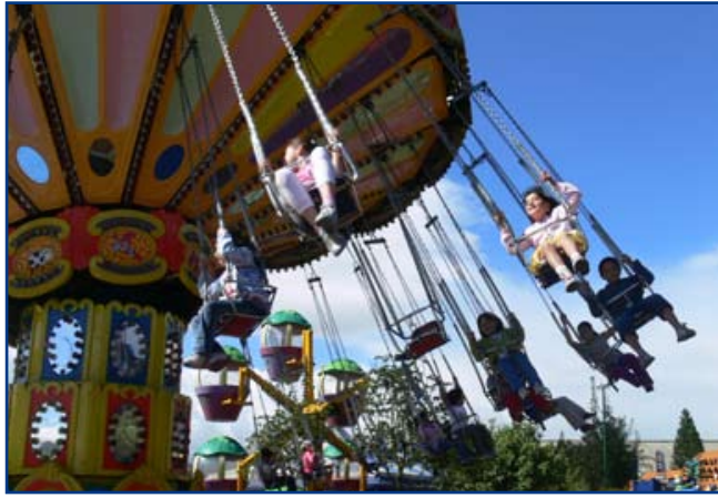
Diversión por todo lo alto