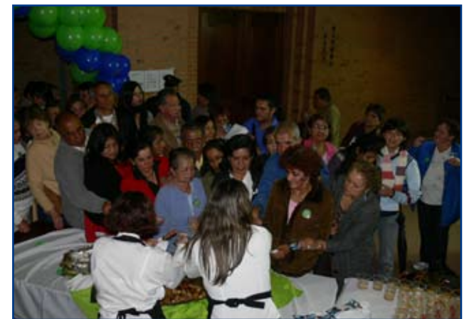
Al final el refrigerio