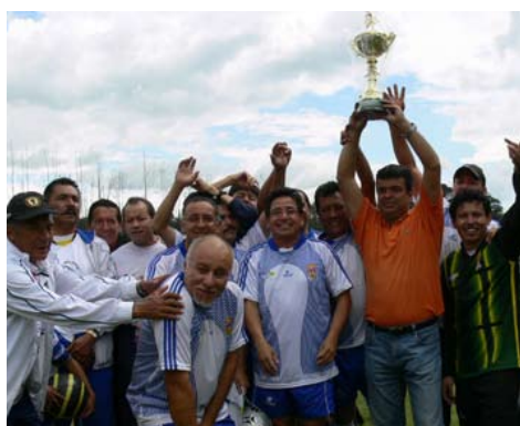
El orgullo de mostrar la copa