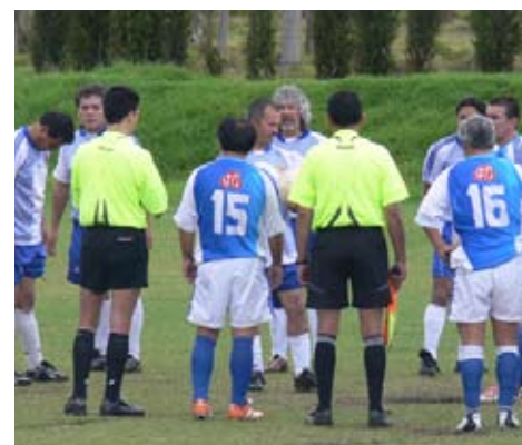
Charla técnica antes del juego